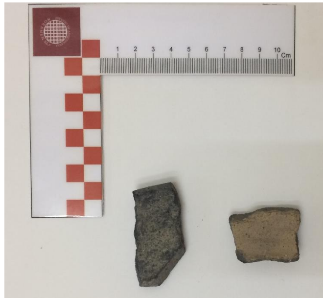
Detalles de alguno de los fragmentos cerámicos localizados, realizados a mano (1) y a torno (2)